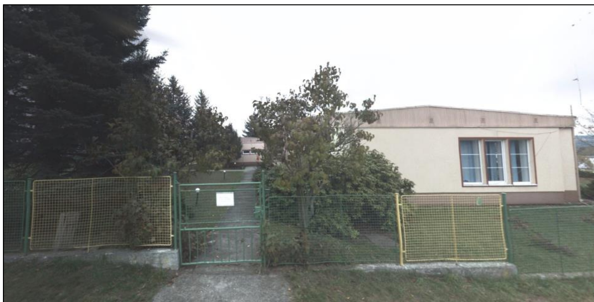
Obrázek 1: Místo srazu, večírku i odpočinku

Sraz: Ulice na vyhlídce 266, Dýšina – první budova od vstupu z ulice Na Vyhlídce